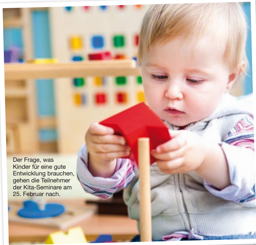
Der Frage, was Kinder für eine gute Entwicklung brauchen, gehen die Teilnehmer der Kita-Seminare am 25. Februar nach.