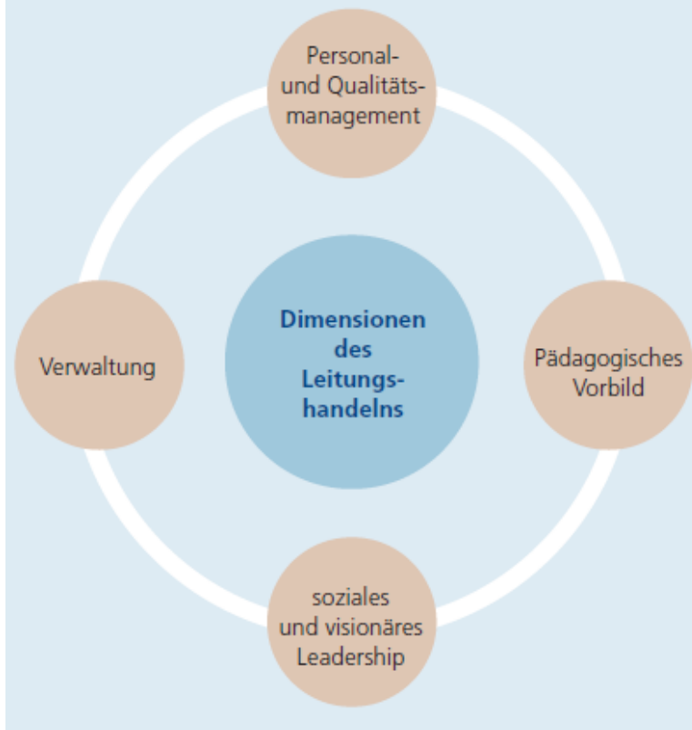
Abb. 3 Leitungshandeln als Bündel organisations- und personenbezogener Aufgaben