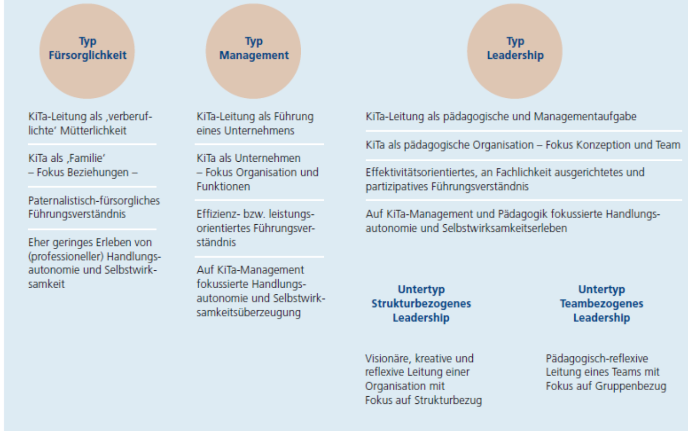
Abb. 2 Typische Erfahrungs- und Orientierungsmuster von KiTa-Leitungen